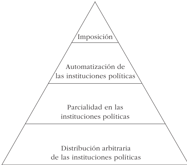
GRÁFICA 2. Estructura vertical del proceso político de las instituciones políticas